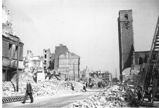
Le Breiter Weg en 1945