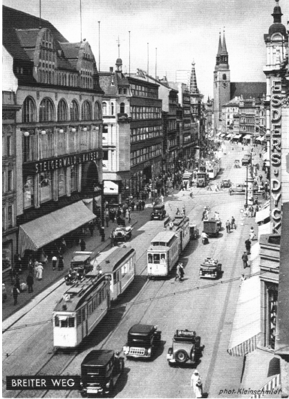
Le Breiter Weg en 1922