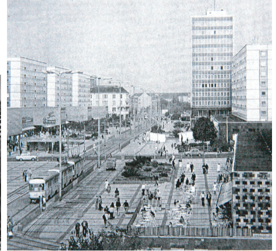
Le Breiter Weg en 1975

Les deux premières photos sont tirées de Landeshauptstadt Magdeburg Stadtplanungsamt Magdeburg (2005) Der Breite Weg. Ein verlorenes Stadtbild Vol. 69. Stadtplanungsamt Magdeburg p.29 & p.44 ; la troisième de Landeshauptstadt Magdeburg Stadtplanungsamt (1996) Entwicklungskonzept Innenstadt Magdeburg . Vol. 54. Landeshauptstadt Magdeburg p. 101.