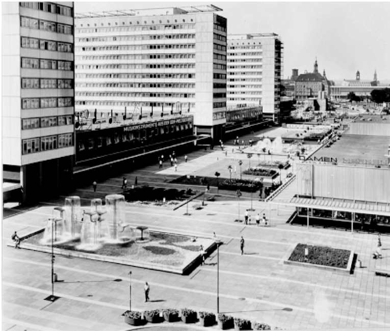
La Prager Straße sous le socialisme