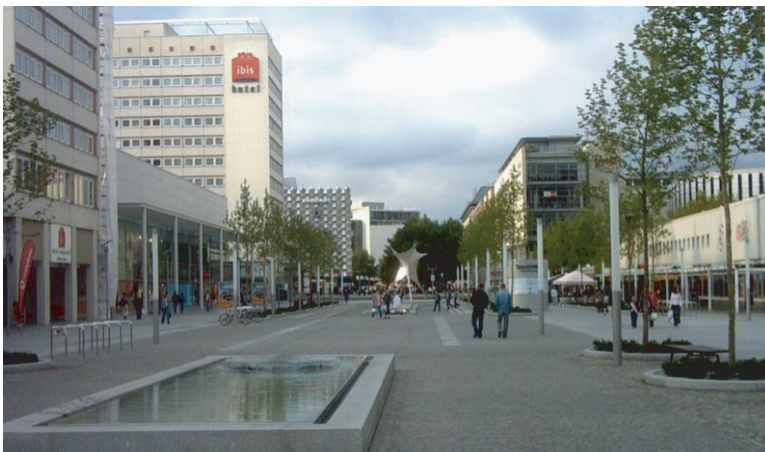
La Prager Straße en 2007

■ bâti existant ou en cours de construction ■ bâtiments à construire